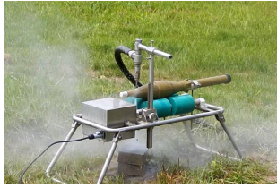
图3 便携式高压水射流切割系统