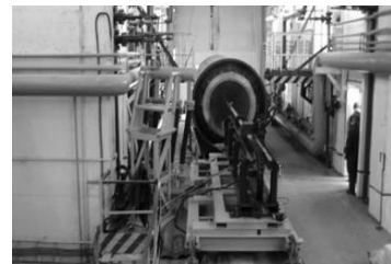
图5 蒸汽水煮融化倒空 TNT

该技术主要通过高温蒸汽、高压釜或热水浴对浇铸式或压装式 TNT 装药以及梯萘混合装药的报废弹药进行加热升温，使其中低熔点的 TNT 组分温度升高至其熔点以上而熔化，进而使其顺利从弹壳中自行流出，达到倒空装药的目的。此技术仅应用于含有低熔点炸药组分的报废弹药，并且会产生污染环境的冷凝废水，如图 5 所示。