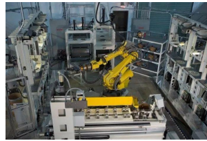
图 1 桑迪亚自动拆卸弹药系统