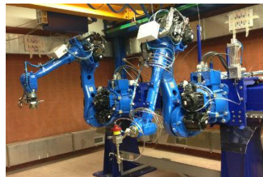
图 2 高压磨料水射流切割系统

(1) 高压磨料水射流切割技术。该技术是一种利用高压（100MPa 以上）预混合磨料水射流切割报废弹药金属壳体且不产生火花、热变形或热效应的冷态物理切割技术。在切割敏感弹药时，可抑制炸药起爆，无有毒或有害气体，安全可靠度不低于 99.52%。操作过程中两相预混合磨料水射流相对三相在原理、火花、静电以及工作效率更具优势 [10] 。意大利 Caretta Technology 公司研发的高压磨料水射流切割系统，如图 2 所示，可用于常规报废弹药的清洁、切割和回收等 [11] 。