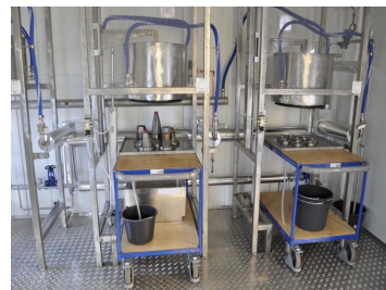
图6 高压水射流分离火炸药

该技术主要采用超高压水或液氮等液体产生的巨大冲击力将装药发生脆性断裂、破碎和脱落，以达到倒药的目的 [20] ，如图 6 所示。